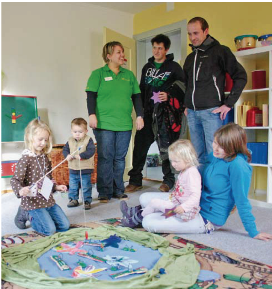
Am Tag der offenen Tür interessierten und informierten sich Gross und Klein über das familienergänzende Angebot der Kinderkrippe Malters.

krippe wahr. Alle Spielsachen haben ihren Platz, jedes Kind sein Fach. Der Tagesablauf hat eine klare Struktur, mit den Essens-, Schlafens- und Programmzeiten, die auch mal im Freien stattfinden. Für die zu betreuenden Kinder sind acht Mitarbeiterinnen zuständig, darunter zwei Lernende.